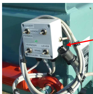
Boîtier de commande en cabine